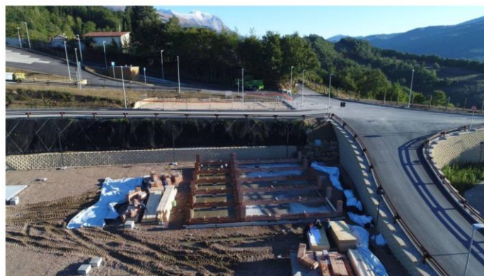
Ad Accumoli nasce "Accupoli"